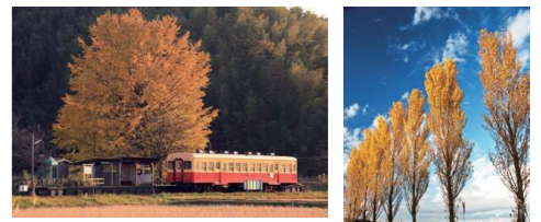
上総久保駅大銀杏